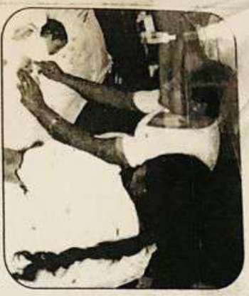
കുടിയൊഴിയിൽ നിന്നും തിരിച്ചെത്തിയവർക്ക് സഹായം നൽകുന്നതിനായി പദ്ധതികൾ തയ്യാറാക്കിയിട്ടുണ്ട്.

കുടിയൊഴിയിൽ നിന്നും തിരിച്ചെത്തിയവർക്ക് സഹായം നൽകുന്നതിനായി പദ്ധതികൾ തയ്യാറാക്കിയിട്ടുണ്ട്. കൂടുതൽ വിവരങ്ങൾക്ക് പദ്ധതികൾക്ക് അനുബന്ധമായി നൽകിയിട്ടുള്ള കോർഡിനേറ്റർക്ക് ബന്ധപ്പെടുക.