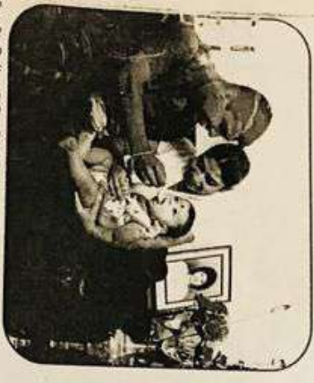
കുടിയൊഴിയിൽ നിന്നും തിരിച്ചെത്തിയവർക്ക് സഹായം നൽകുന്നതിനായി പദ്ധതികൾ തയ്യാറാക്കിയിട്ടുണ്ട്.